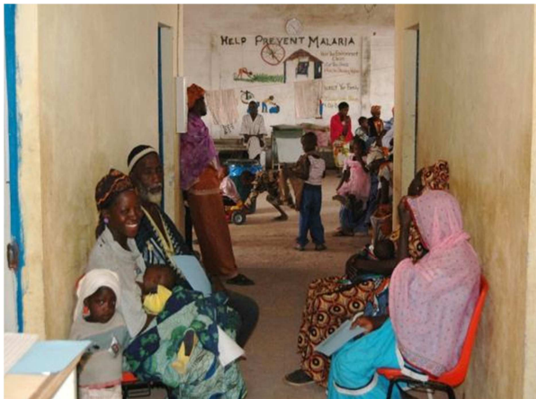
Die Wartehalle ist immer voll besetzt

Selbstverständlich bekommen Sie für Ihre Spende eine Zuwendungsbescheinigung.