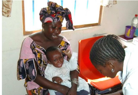
Die meisten Patienten sind Mütter mit Kindern

Täglich werden im Gesundheitszentrum bis zu 60 Patienten versorgt! Davon sind ca. 70 % Kinder Sehr lange Anreisen sind keine Seltenheit!