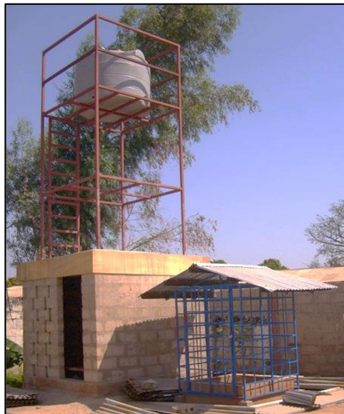
Der Wasserturm und direkt davor der Grundwasserbrunnen

Die staatliche Trinkwasserversorgung ist in Gambia nicht permanent gewährleistet. Im Jahr 2010 baute RDI e.V. für das Dorf Buniadu und für das Gesundheitszentrum einen Wasserturm mit einem 2.000 Liter Wassertank. Dafür wurde ein Tiefwasserbrunnen zur Gewinnung von Trinkwasser gebohrt.