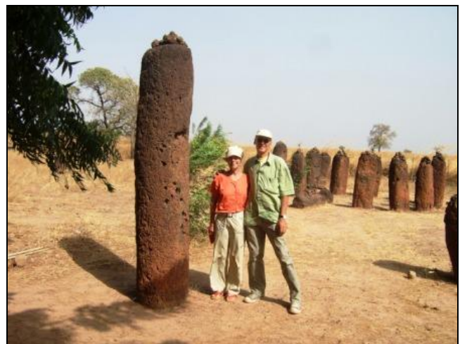
Besuch bei den Steinkreisen von Wassu