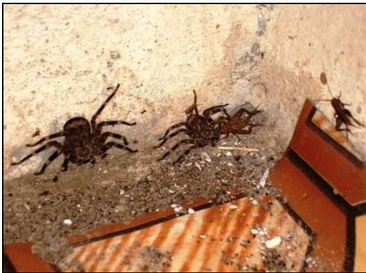
Diese Untermieter mussten leider ausziehen.....

Das alte Wellblechdach hatte den Wassermassen während der Regenzeit nicht mehr standgehalten und so hatten sich die Zimmerdecken gewellt und große braune Flecken bekommen, die sich auch nicht durch Überstreichen ausbessern ließen. Alle 4 Räume des HC sowie der Flur wurden mit gambianischer Binderfarbe (Marke: Extradünn) mehrfach gerollt, um ein deckendes Ergebnis zu erhalten. Für Spinnen und Heimchen gab es keinen Platz mehr, nachdem der Fußboden rund ums Waschbecken gefliest wurde. Natürlich kam auch das berühmte „RDI-Blau“ zum Einsatz. Alle Türen und Fenster wurden damit gestrichen, auch die Wände rund um das Waschbecken. Wir putzten das gesamte Mobiliar so wie Fenster und Fußböden, Türen gründlich. Als nach zwei Wochen das Dach fertiggestellt war, konnten dann Möbel, Medizin und Geräte in die Zimmer eingeräumt werden. Heike, die sich schon um ihre Patienten sorgte, war froh, dass die Räume nun wieder ihrer eigentlichen Bestimmung übergeben werden konnten.