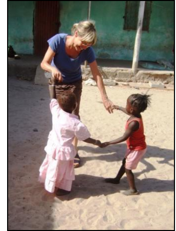
Ringelreihen mit den Kindern

Wenn wir uns gegen 8 Uhr auf den sandigen Weg zum HC machten, saß die Sippe schon im Hof und teilte sich die große Schüssel Hirsebrei. Mit viel „sama dawedi“ (wie ist der Morgen) und „i sama“ (guten Morgen) und Schütteln vieler Kinderhände bahnten wir uns den Weg.