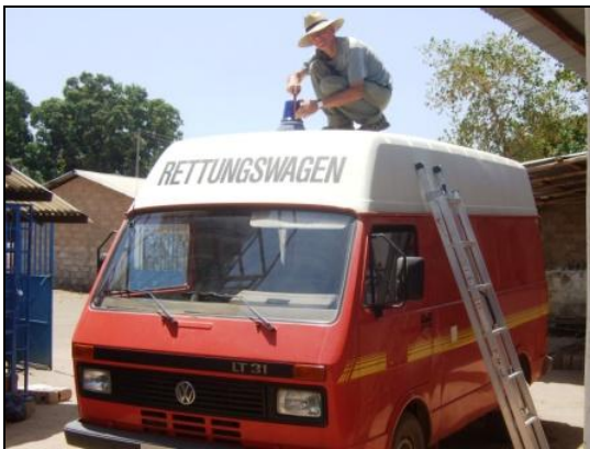
das „neue“ Blaulicht funktioniert!

Auch nach der Wiedereröffnung des HC gab es für uns Volontäre noch genug zu tun: Der Rettungswagen bekam ein „neues“ Blaulicht (vom Bremer Schrottplatz) und eine englische Beschriftung, der Sockel des Wasserturms war zu verputzen (da sollte die Energiezentrale hinein), die von Heike vorgezogenen Bougainvillen sollten längs der Hofmauer als „blühender Stachelzaun“ gepflanzt und aus Sperrholzresten ein paar praktische Regale gebaut werden.