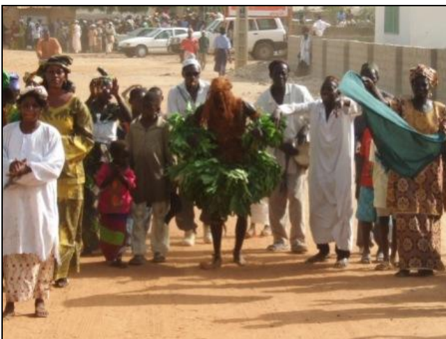
Kuntaur: Festumzug mit dem Jamba Kankurang