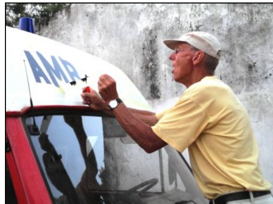
AMBULANCE kann nun jeder lesen (der lesen kann)