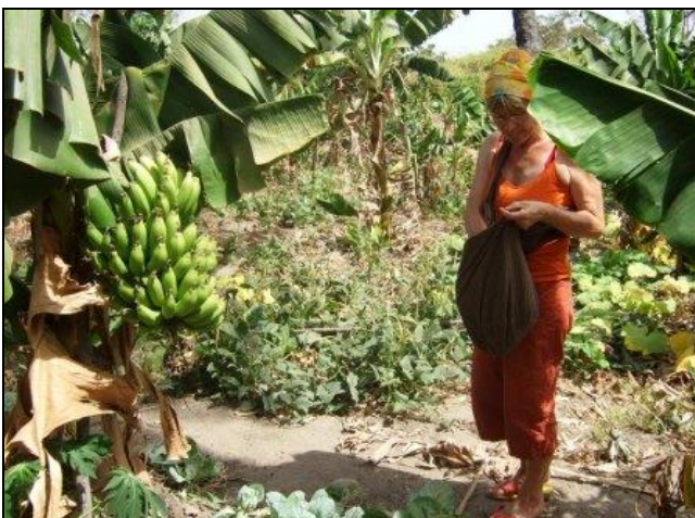
In den üppigen Palmgärten von Buniadu

An Wochenenden hatten wir Zeit, bei Spaziergängen die schöne Umgebung von Buniadu kennen zu lernen, den Nebenflüssen des Gambia River (Bolong) nachzugehen und die wunderbaren Palmgärten zu durchstreifen, in denen die Dorfbewohner im Halbschatten der Ölpalmen Gemüse anbauen für den eigenen Bedarf, oder auch für den täglichen Markt der Provinzhauptstadt Barra, wo dann die Bananen, Gurken, Paprika, Kartoffeln oder Pfefferminze von den Frauen verkauft werden. Damit verschaffen sie sich ein eigenes kleines Budget, das ihnen unabhängig vom Ehemann erlaubt, etwas für die Kinder einzukaufen oder sich selbst hin und wieder mal einen Wunsch zu erfüllen ( beispielsweise Stoff zu kaufen und sich vom Dorfschneider ein hübsches Kleid nähen zu lassen).