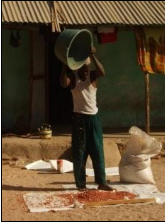
Erdnüsse von der Spreu trennen