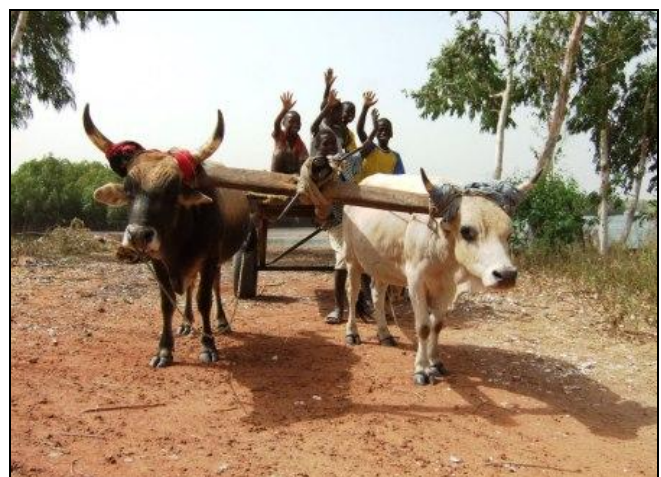
Ochsengepann mit Kindern am Weg zum Bolong