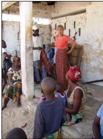
Anprobe beim Dorfschneider