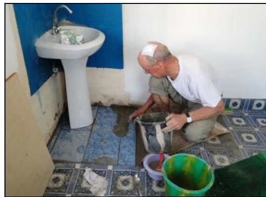
.....gefliesen Fußboden mögen sie nicht