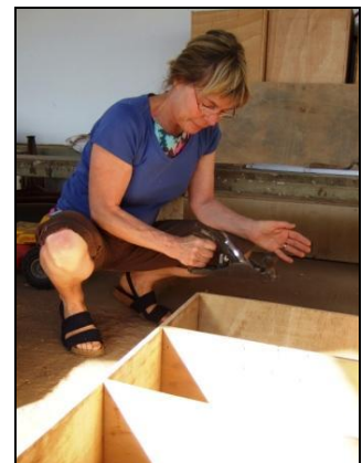
und praktische Regale bauen