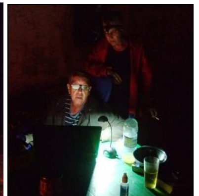
Endlich Feierabend! Am Lagerfeuer klönen, singen, tanzen und - - - Buchführung am PC erledigen