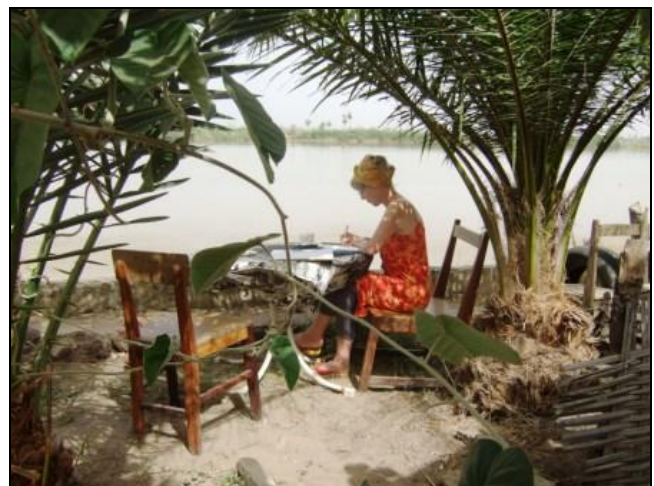
Kuntaur: Lodge „Kairoh Garden“ am Gambia River