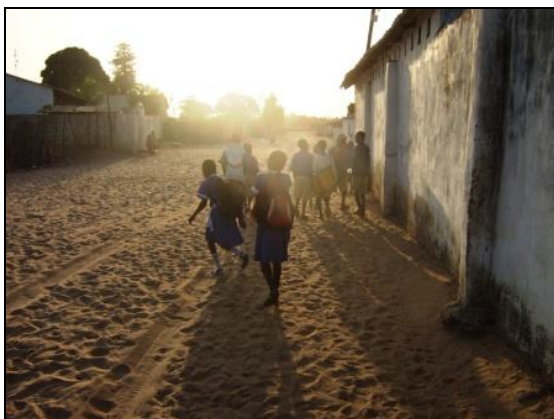
Mädchen auf den Weg zur Schule in Berending

Wenn wir uns gegen 8 Uhr auf den sandigen Weg zum HC machten, saß die Sippe schon im Hof und teilte sich die große Schüssel Hirsebrei. Mit viel „sama dawedi“ (wie ist der Morgen) und „i sama“ (guten Morgen) und Schütteln vieler Kinderhände bahnten wir uns den Weg.