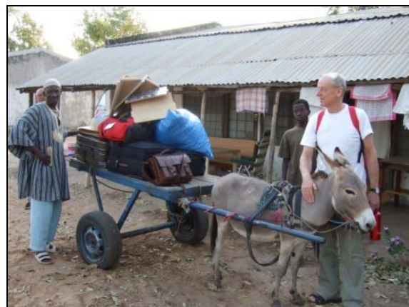
Umzug von der Lodge in die Dorfmitte